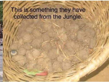
This is something they have collected from the Jungle.